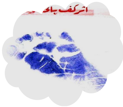
اثر کف پا

این منظور پرستاران دو کار انجام می دهند: