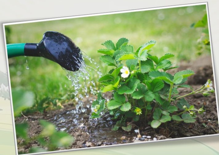
آب و هوا